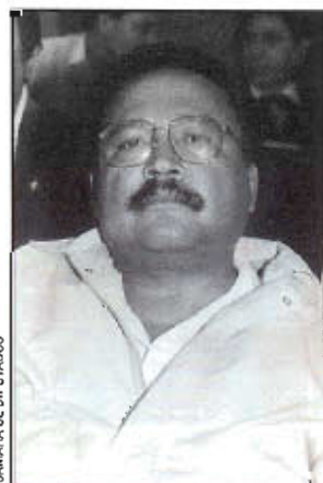
CÁMARA DE DIPUTADOS

Egresado de la Universidad Nacional Autónoma de México, donde estudió licenciatura en derecho, es miembro del PRI desde 1960 y tuvo a su cargo la Secretaría General de la Liga de Comunidades Agrarias y Sindicatos Campesinos del Estado de Guerrero. Nació el 26 de mayo de 1942 en El Bejuco, Guerrero, estado al que ha representado como diputado federal por el IX distrito con cabecera en Tecpan de Galeana y se desempeña como presidente de la Comisión de Asuntos Indígenas, además de participar en las comisiones de Agricultura y Recursos Hidráulicos; Ganadería; Gobernación y Puntos Constitucionales.