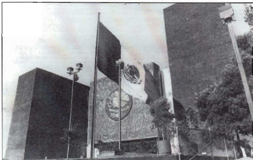
CÁMARA DE DIPUTADOS