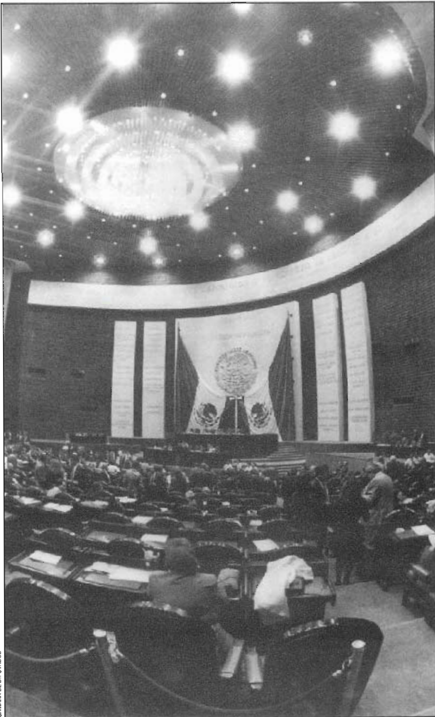
CÁMARA DE DIPUTADOS

La inquietud es tal que durante el trienio se presentan varias iniciativas de reforma