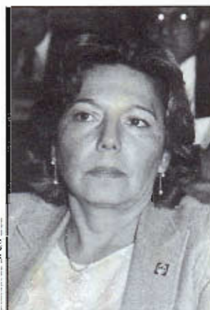
CÁMARA DE DIPUTADOS

Egresada de la Universidad Nacional Autónoma de México, donde estudió licenciatura en derecho, nació en Chapantongo, Hidalgo, el 29 de agosto de 1940. Pertenece al PRI desde 1971, donde ha sido secretaria general del Comité Municipal de la Asociación Nacional Femenil Revolucionaria (ANFER) en Ecatepec, Estado de México; delegada especial del Comité Directivo Estatal; delegada regional; subsecretaria de acción femenil de la Federación de Organizaciones Populares del Estado de México; presidenta del Frente Popular de Mujeres Mexiquenses de Ecatepec; secretaria general de la Liga Municipal de la Confederación Nacional de Organizaciones Populares en Ecatepec; secretaria de Promoción y Gestoría de la Federación de Organizaciones Populares y presidenta del Frente Ecatepec. Fungió como asesora jurídica de la Dirección de Acción Social del Departamento de Protección Social del Departamento del Distrito Federal y abogada B del Departamento de Rezago y Ejecución Fiscal en la Secretaría de Finanzas del Gobierno del Estado de México. Fue regidora del Ayuntamiento de Ecatepec y en la presente Legislatura, diputada federal por el XXX distrito del Estado de México, con cabecera en Ecatepec; forma parte de las comisiones de Justicia; Población y Desarrollo; Información, Gestoría y Quejas; y de Artesanías.