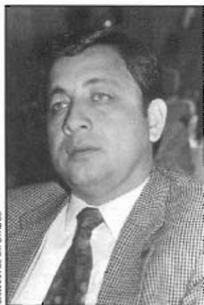
CÁMARA DE DIPUTADOS

De Cuicatlán, Oaxaca, donde nació el 27 de septiembre de 1947, realizó estudios de ingeniería industrial en el Instituto Tecnológico de Oaxaca y una maestría en administración pública en el Instituto Tecnológico de Estudios Superiores de Monterrey. En el Partido Revolucionario Institucional, al cual pertenece desde 1947, ha sido delegado en el III distrito electoral de Oaxaca; secretario adjunto del presidente del CDE; presidente del Comité Municipal e integrante del Consejo Político Nacional. Ha tenido bajo su responsabilidad diversas instituciones tecnológicas de la SEP en el estado de Oaxaca, donde también fue director del CREA y delegado del Registro Nacional de Electores. Le fue otorgado el Premio Estatal del Deporte y es autor de las publicaciones "Plan de desarrollo del sistema nacional de institutos tecnológicos" y "Manual de contabilidad para el sistema de institutos tecnológicos". En la LV Legislatura representa como diputado federal al V distrito electoral con cabecera en Huautla, Oax., y pertenece a las comisiones de Programación, Presupuesto y Cuenta Pública; Comercio; Educación; Distrito Federal; es miembro del Comité de Bibliotecas.