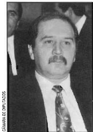
CÁMARA DE DIPUTADOS