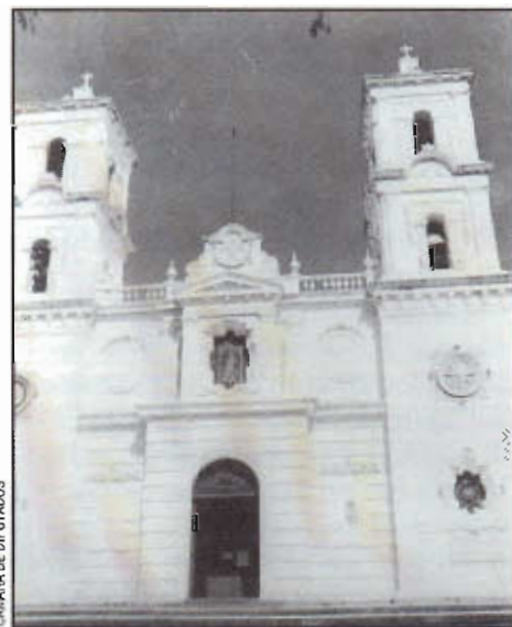
El Primer Congreso de Anáhuac se instaló aquí, en la Parroquia de Santa María de la Asunción de la ciudad de Chilpancingo, en el año de 1813, de donde surgieron también Los Sentimientos de la Nación del generalísimo José María Morelos y Pavón.

Así, el conjunto legislativo actual, su estructura y sus servicios, su funcionalidad y diseño sirven de marco para lograr los ideales externados por la legisladora Moreno Uriegas: "Hemos participado (en el Congreso) con la certidumbre de que la proyección de la