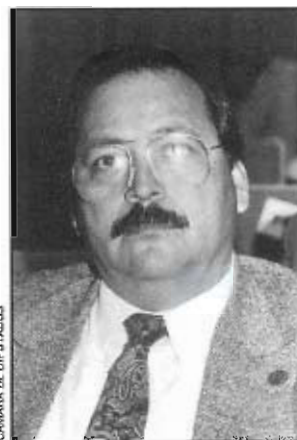
CÁMARA DE DIPUTADOS

De Cuicatlán, Oaxaca, donde nació el 27 de septiembre de 1947, realizó estudios de ingeniería industrial en el Instituto Tecnológico de Oaxaca y una maestría en administración pública en el Instituto Tecnológico de Estudios Superiores de Monterrey. En el Partido Revolucionario Institucional, al cual pertenece desde 1947, ha sido delegado en el III distrito electoral de Oaxaca; secretario adjunto del presidente del CDE; presidente del Comité Municipal e integrante del Consejo Político Nacional. Ha tenido bajo su responsabilidad diversas instituciones tecnológicas de la SEP en el estado de Oaxaca, donde también fue director del CREA y delegado del Registro Nacional de Electores. Le fue otorgado el Premio Estatal del Deporte y es autor de las publicaciones "Plan de desarrollo del sistema nacional de institutos tecnológicos" y "Manual de contabilidad para el sistema de institutos tecnológicos". En la LV Legislatura representa como diputado federal al V distrito electoral con cabecera en Huautla, Oax., y pertenece a las comisiones de Programación, Presupuesto y Cuenta Pública; Comercio; Educación; Distrito Federal; es miembro del Comité de Bibliotecas.