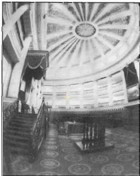
El Palacio Nacional también dio albergue a la Cámara de Diputados, cuya Sala de Sesiones fue instalada en el Salón Emperadores. Justamente aquí se juró la Constitución del 5 de febrero de 1857.

Del infortunio se pasó a la creatividad arquitectónica para acondicionar, bajo un enfoque funcional apegado a las necesidades de los legisladores y acorde con sus tareas específicas, los 28,000 metros cuadrados de superficie construida.