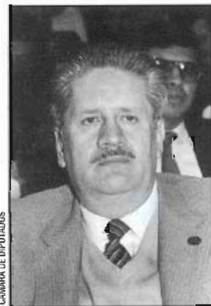
CÁMARA DE DIPUTADOS

Nació en Canelas, Durango, el 27 de julio de 1942. Realizó estudios de preparatoria y es militante priista desde 1960, partido dentro del cual ha desempeñado los cargos de coordinador regional en la XIV Asamblea Nacional; secretario de Acción Deportiva en el XVI distrito del D.F.; delegado regional en varios distritos de la ciudad de México y presidente del XXXV distrito del D.F. Fue empleado federal de Correos y delegado sindical en la Sección de Correos del D.F., también ocupó diversos cargos en el Sindicato Nacional de Trabajadores de la Secretaría de Comunicaciones y Transportes (SCT) y en la Federación de Sindicatos de Trabajadores al Servicio del Estado (FSTSE). Ha sido diputado federal en la LIII y LV Legislaturas; en esta última representa al XXXV distrito electoral y pertenece a las comisiones del Distrito Federal; Seguridad Social; Vigilancia de la Contaduría Mayor de Hacienda; en la de Comunicaciones y Transportes se desempeña como secretario.