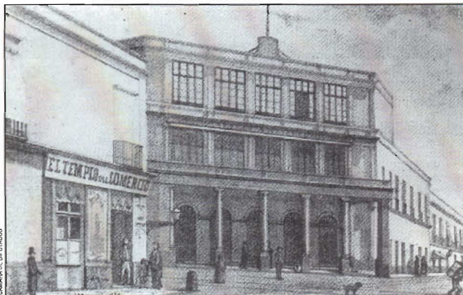
Como recinto parlamentario funcionó también el Teatro Iturbide, ubicado en la esquina de Donceles y Allende, que fue habilitado como tal el 10. de diciembre de 1872.

E ntre la casona de adobe en Zitácuaro, Michoacán, donde se constituyó en 1811 la Suprema Junta Nacional Americana y el nuevo conjunto legislativo de San Lázaro en la capital de la República, que alberga la LV Legislatura, existe enorme distancia en el tiempo y diametral diferencia arquitectónica, pero también una estrecha relación histórica que sintetiza la configuración jurídica, política y social de la nación.