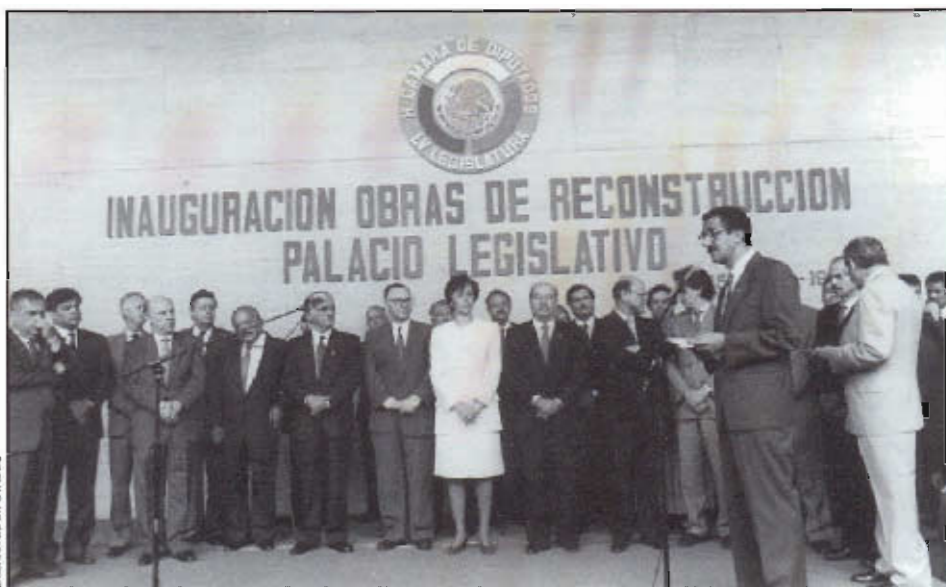
La presidenta de la Gran Comisión de la Cámara Baja, María de los Ángeles Moreno Uriegas, acompañada del Secretario de Gobernación, Jorge Carpizo McGregor, y del presidente de la Gran Comisión del Senado de la República, Humberto Lugo Gil, durante el acto de inauguración de la segunda fase de reconstrucción de los edificios "C" y "G" y Plaza Cívica del parlamento mexicano.

Hizo énfasis en que la pluralidad de la comisión no fue obstáculo para el acuerdo: "Siempre imperó el ánimo de arribar rápidamente a decisiones consensadas y lo logramos, demostrando