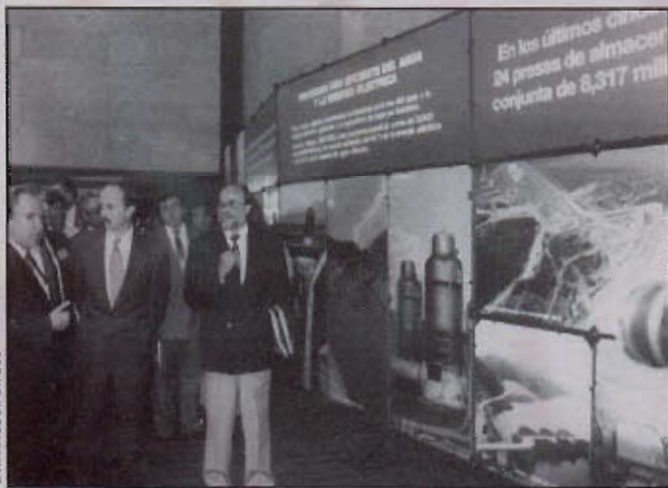
CÁMARA DE DIPUTADOS

Durante la clausura del Foro Nacional sobre la Ley de Aguas Nacionales y su Reglamento, organizado por la Comisión de Asuntos Hidráulicos de la Cámara de Diputados, se trató el tema del vital líquido desde el punto de vista del desarrollo sustentable y se precisaron ideas para interactuar en el marco de una nueva cultura del agua.