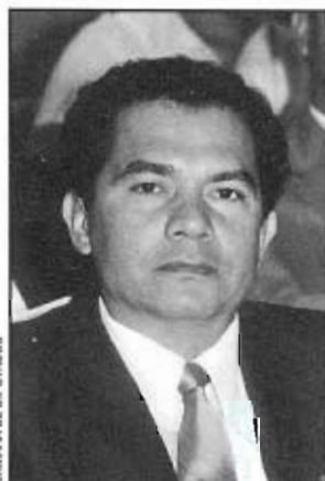
CÁMARA DE DIPUTADOS

De Granadilla, Veracruz, donde nació el 15 de abril de 1944. Realizó estudios de licenciatura en derecho en la Universidad Veracruzana y licenciatura en educación primaria en la Universidad Pedagógica Nacional; dentro del PRI, al cual pertenece desde 1974, ha sido secretario de Prensa del Comité Municipal Juvenil de Jalapa; delegado especial y distrital en varios municipios de Veracruz; secretario general del Comité Municipal en Chicotepec, Ver. Fue secretario de Organización del Comité del Sindicato Estatal de Trabajadores al Servicio de la Educación y oficial mayor en la Confederación Nacional Campesina (CNC); presidente municipal de Chicotepec y diputado local suplente en Veracruz. Tuvo a su cargo la Dirección del Instituto de Regularización Pedagógica y la Preparatoria Justo Sierra. En la LV Legislatura representa como diputada federal al XVII distrito electoral con cabecera en Chicotepec, Ver., y pertenece a las comisiones de Reforma Agraria; Educación; Turismo; Patrimonio y Fomento Industrial; y Derechos Humanos.