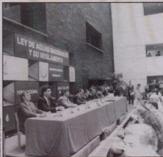
CÁMARA DE DIPUTADOS

El evento tuvo como propósito dar a conocer las conclusiones de las reuniones regionales celebradas a lo largo de tres meses en Monterrey, Nuevo León; Villahermosa, Tabasco; Querétaro, Qro.; Torreón, Coahuila y Ciudad Obregón, Sonora, con aportaciones de la sociedad, organismos operadores, estructuras del Ejecutivo y trabajo legislativo. Reuniones de esta naturaleza hacen más grande la labor legislativa y brindan la oportunidad de extenderla a la sociedad, en interacción permanente.