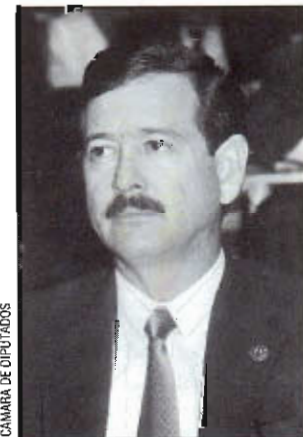
CÁMARA DE DIPUTADOS

Pertenece al PAN desde 1983, donde ha desempeñado los cargos de director de campaña en Ciudad Juárez y Chihuahua, así como presidente del partido en Chihuahua. Nació en la ciudad de Chihuahua el 20 de marzo de 1949 y realizó estudios de licenciatura en administración de empresas en el Instituto Tecnológico Regional de Ciudad Juárez. Fue consejero de la CANACO y vicepresidente de la CANACINTRA. En la LV Legislatura es diputado federal por la segunda circunscripción plurinominal y pertenece a las comisiones de Patrimonio y Fomento Industrial; Comercio; es secretario de la de Asuntos Fronterizos.