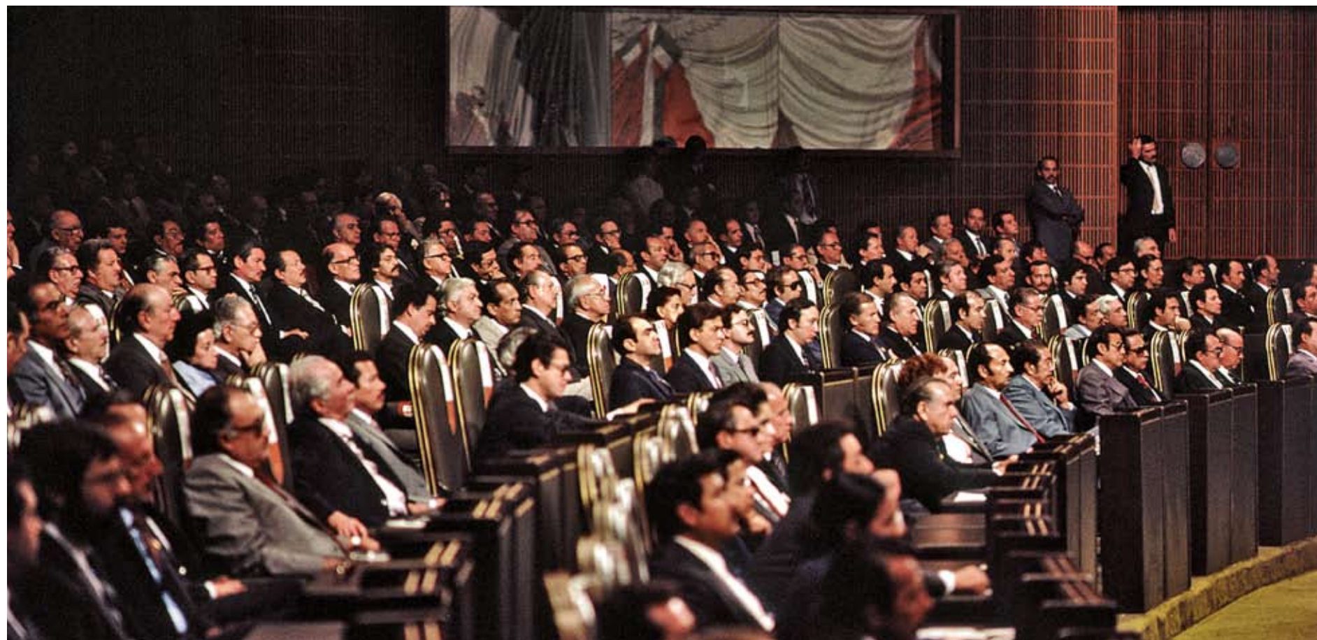
Escenario de la Sesión Solemne de instalación del primer periodo ordinario de sesiones del tercer año de ejercicio constitucional de la LI Legislatura del Honorable Congreso de la Unión.