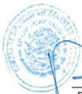
Dip. Dulce María Sauri Riancho Presidenta

S A L Ó N DE SESIONES DE LA CÁMARA DE DIPUTADOS DEL HONORABLE CONGRESO DE LA UNIÓN.- Ciudad de México, a 19 de noviembre de 2020.