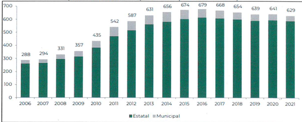
Saldo de la deuda total/ 1 (Miles de millones de pesos de septiembre de 2021)

DICTAMEN DE LAS COMISIONES UNIDAS DE HACIENDA Y CRÉDITO PÚBLICO, Y DE ESTUDIOS LEGISLATIVOS, SEGUNDA, CORRESPONDIENTE A LA MINUTA PROYECTO DE DECRETO POR EL QUE SE ADICIONAN DIVERSAS DISPOSICIONES DE LA LEY DE DISCIPLINA FINANCIERA DE LAS ENTIDADES FEDERATIVAS Y LOS MUNICIPIOS.