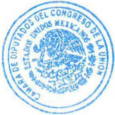
Dip. Sergio Carlos Gutiérrez Luna Presidente

SALÓN DE SESIONES DE LA CÁMARA DE DIPUTADOS DEL HONORABLE CONGRESO DE LA UNIÓN. Ciudad de México, a 18 de octubre de 2021.