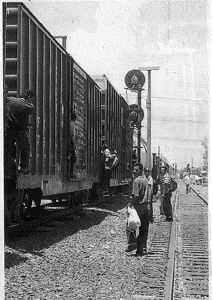
Unos cruzan por las garitas, otros por el desierto