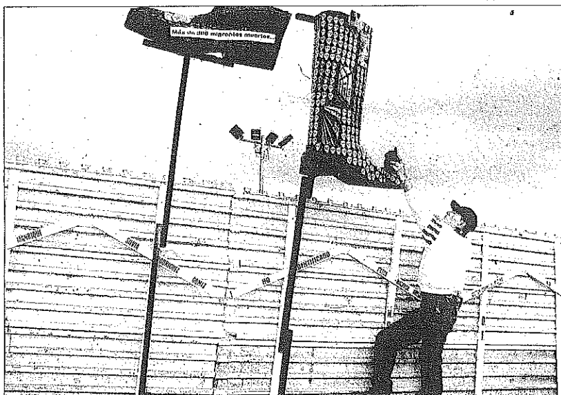
DESCONOCIDOS. Cementerios de Estados Unidos están llenos con los John y Jane Doe muertos al cruzar la frontera.