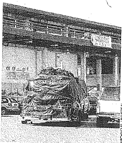
EL RETORNO Los migrantes huyen de EU con camionetas cargadas hasta el tope

Hace tres años que llegó a Estados Unidos