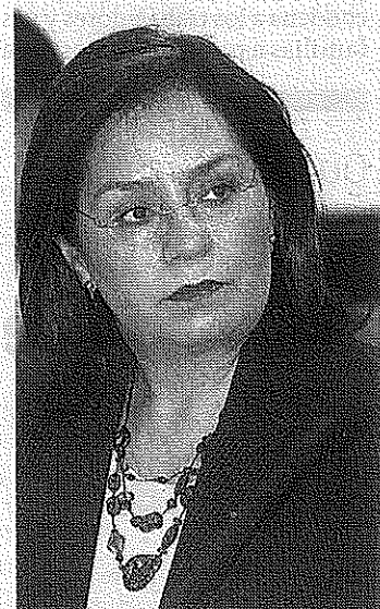
La titular de Relaciones Exteriores

que se puede expedir a favor de cualquier mexicano, sin importar su edad, pues recordó que la credencial de elector sólo se entrega a ciudadanos mayores de 18 años y la cartilla a hombres mayores de edad.