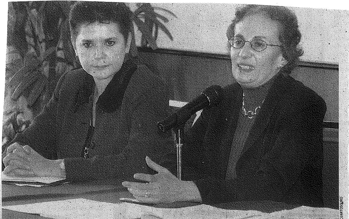
FUTURO NEGRO: Para sortear las dificultades económicas, algunas personas preferirán arriesgarse a inmigrar.

condiciones económicas, España ha implementado programas de retorno voluntario para los expatriados, a quienes se les ayuda económicamente para volver a su país.