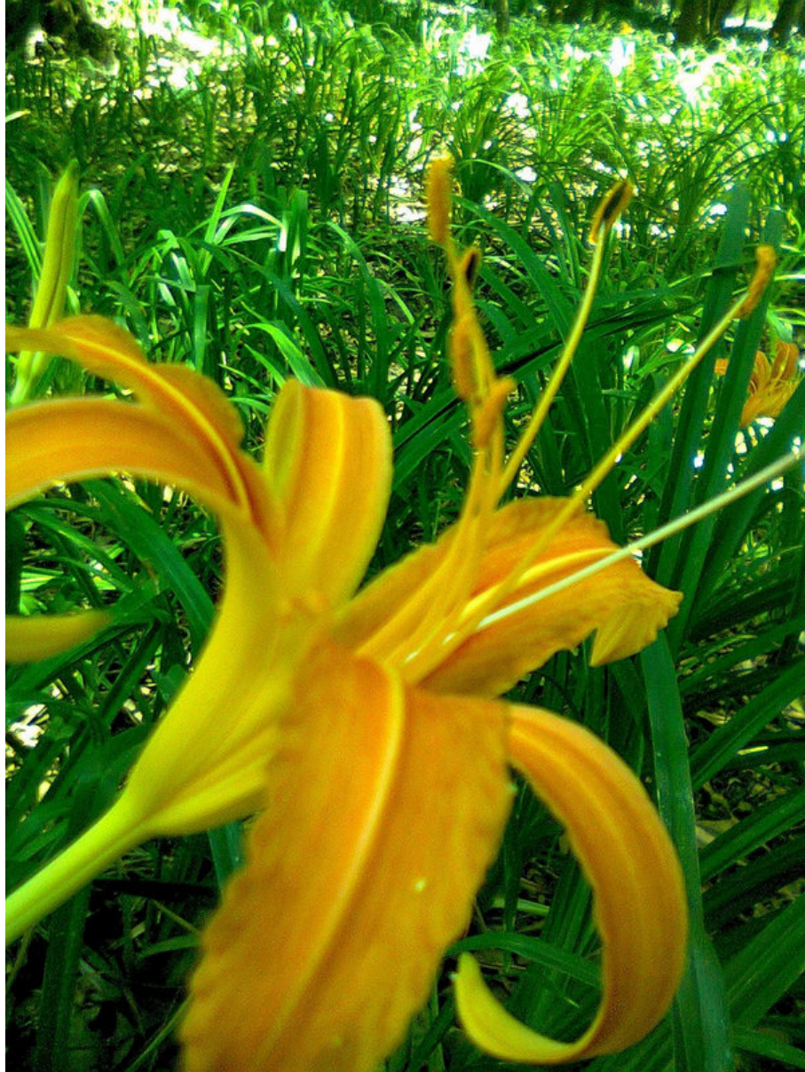
FLOR EN CHAPULTEPEC JAVIER ICTECATL BARCENAS GRANADOS Folio: 66 Votos: 1057 de 12257