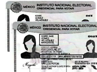
Tipo G y H