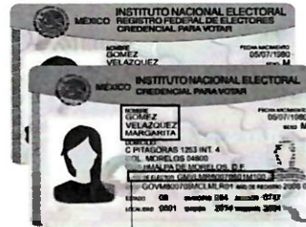
Tipo D y F