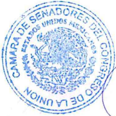
SEN. ANA LILIA RIVERA RIVERA Presidenta

SALÓN DE SESIONES DE LA HONORABLE CÁMARA DE SENADORES.- Ciudad de México, a 5 de marzo de 2024