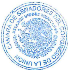
SEN. VERÓNICA NOEMÍ CAMINO FARJAT Secretaria

LA QUE SUSCRIBE, SENADORA VERÓNICA NOEMÍ CAMINO FARJAT, SECRETARIA DE LA MESA DIRECTIVA DE LA CÁMARA DE SENADORES, CORRESPONDIENTE AL TERCER AÑO DE EJERCICIO DE LA SEXAGÉSIMA QUINTA LEGISLATURA, CON FUNDAMENTO EN EL ARTÍCULO 220.4 DEL REGLAMENTO DEL SENADO DE LA REPÚBLICA, HACE CONSTAR QUE EL PRESENTE ES EL EXPEDIENTE ORIGINAL DEL PROYECTO DE DECRETO POR EL QUE SE REFORMAN Y ADICIONAN DIVERSAS DISPOSICIONES DE LA LEY DE AGUAS NACIONALES Y DEL CÓDIGO PENAL FEDERAL Y QUE SE REMITE A LA CÁMARA DE DIPUTADOS EN CUMPLIMIENTO DEL ARTÍCULO 220 DEL REGLAMENTO DEL SENADO PARA LOS EFECTOS DEL ARTÍCULO 72 CONSTITUCIONAL.