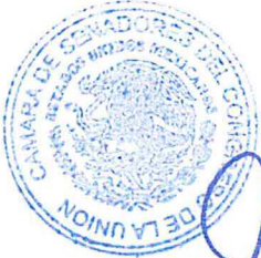
SEN. ANA LILIA RIVERA RIVERA Presidenta

SALÓN DE SESIONES DE LA HONORABLE CÁMARA DE SENADORES.- Ciudad de México, a 7 de febrero de 2024