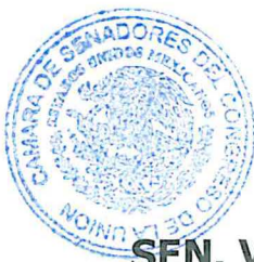
SEN. VERÓNICA NOEMÍ CAMINO FARJAT Secretaria

LA QUE SUSCRIBE, SENADORA VERÓNICA NOEMÍ CAMINO FARJAT, SECRETARIA DE LA MESA DIRECTIVA DE LA CÁMARA DE SENADORES, CORRESPONDIENTE AL TERCER AÑO DE EJERCICIO DE LA SEXAGÉSIMA QUINTA LEGISLATURA, CON FUNDAMENTO EN EL ARTÍCULO 220.4 DEL REGLAMENTO DEL SENADO DE LA REPÚBLICA, HACE CONSTAR QUE EL PRESENTE ES EL EXPEDIENTE ORIGINAL DEL PROYECTO DE DECRETO POR EL QUE SE REFORMA EL ARTÍCULO 6 Y LA FRACCIÓN I DEL ARTÍCULO 11 DE LA LEY GENERAL DE DESARROLLO SOCIAL, EN MATERIA DE DERECHOS HUMANOS Y QUE SE REMITE A LA CÁMARA DE DIPUTADOS EN CUMPLIMIENTO DEL ARTÍCULO 220 DEL REGLAMENTO DEL SENADO PARA LOS EFECTOS DEL ARTÍCULO 72 CONSTITUCIONAL.