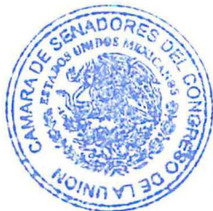
SEN. ANA LILIA RIVERA RIVERA Presidenta

SALÓN DE SESIONES DE LA HONORABLE CÁMARA DE SENADORES.- Ciudad de México, a 25 de octubre de 2023