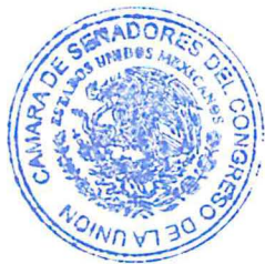
SEN. ANA LILIA RIVERA RIVERA Presidenta

SALÓN DE SESIONES DE LA HONORABLE CÁMARA DE SENADORES.- Ciudad de México, a 25 de octubre de 2023.