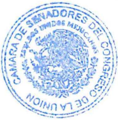
SEN. ANA LILIA RIVERA RIVERA Presidenta

SALÓN DE SESIONES DE LA HONORABLE CÁMARA DE SENADORES.- Ciudad de México, a 4 de octubre de 2023