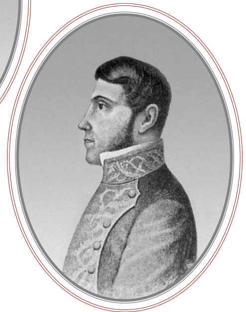
Juan Aldama 1774-1811