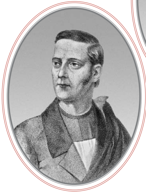
Mariano Matamoros 1770-1814