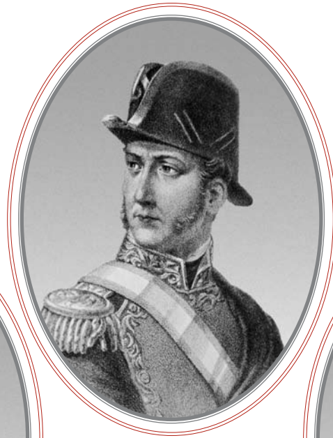
Ignacio Allende 1769-1811