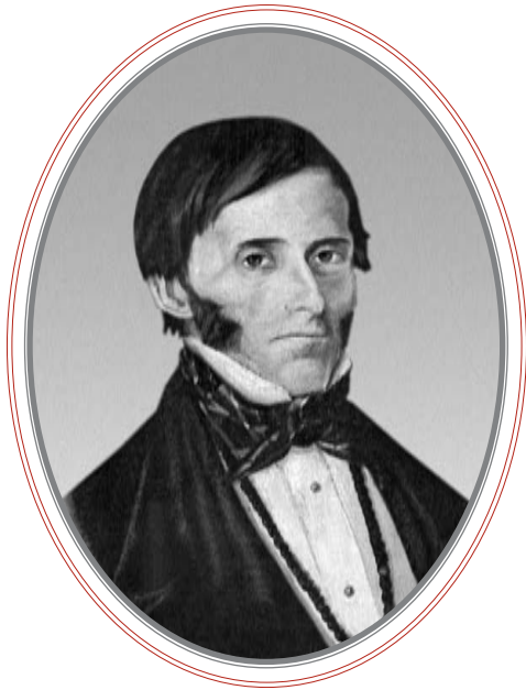
Hermenegildo Galeana 1762-1814