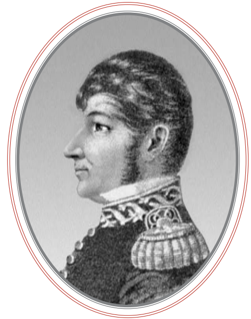
Leonardo Bravo 1764-1812